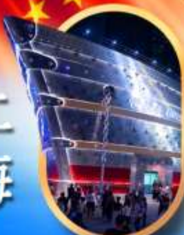
เรือเดอะหลุยส์