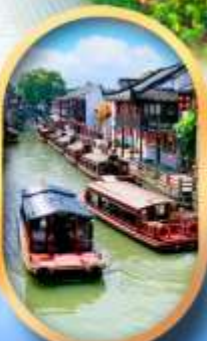
ถนนชานกั๊งเจีย