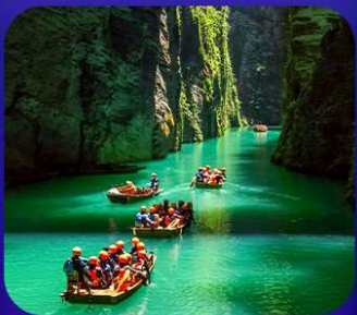
“ ผิงซานแกรนด์แคนย่อน ”

เที่ยวจีน 2 มณฑล เสฉวน+หูเป่ย์ • ถ้าเถิงหลง • หุบเขาสิงโต ซื่อจื่อกวน ล่องเรือมังกรก้งสู่ยชมวิวยามค่ำคืน • ผิงซานแกรนด์แคนย่อน (รวมล่องเรือ) หงหยาดัง • จุดชมรถไฟฟ้าทะลุตึก • ตึกตะเกียบ • สือปาที • หลงเหมินฮ่าว