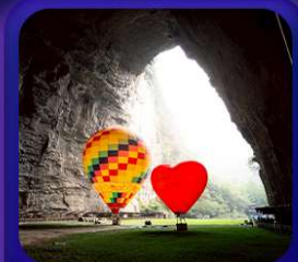
“ ถ้าเถิงหลง ”