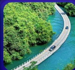
“ หุบเขาสิงโต ซื่อจื่อกวน ”