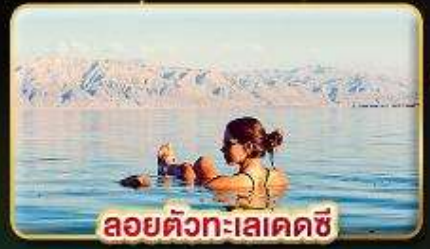
ลอยตัวทะเลเดคซี