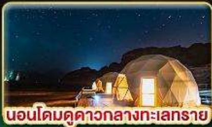
นอนโดมดูดาวกลางทะเลทราย

★ บินตรงสู่ "จอร์แดน" เยือน 7 มหัศจรรย์ของโลก