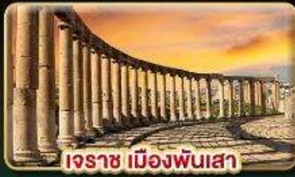
เอราซ เมืองพันเสา