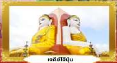
เจดีย์โรฎิน