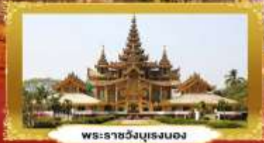
พระราชวังบุเรงนอง

ย่างกุ้ง • หงสาวดี • อินทร์แวง | 3 วัน 2 คืน