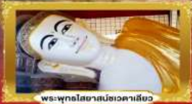
พระพุทธรูปไสยาสน์ชเวดาคะสิย