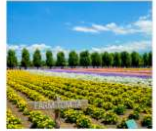
ทุ่งลาเวนเดอร์โทมิตะ