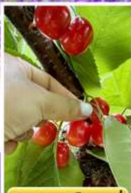
กิจกรรมเก็บเชอร์รี่

ออนเซ็น 2 คืน มน.กระเป๋า 23 กก. 1ใบ 6Days 4Night