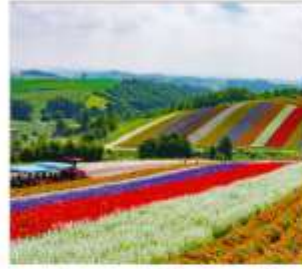
ทุ่งดอกไม้หลากสี