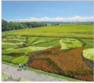
ศิลปะบนทุ่งนา