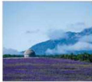
เนินพระพุทธรเจ้า