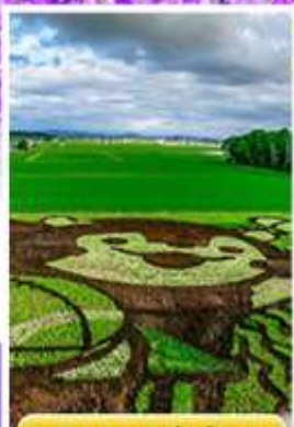
ศิลปะบนทุ่งข้าว