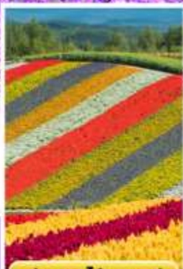
ทุ่งดอกไม้หลากสี