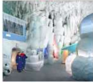
พิพิธภัณฑน์น้ำแข็ง