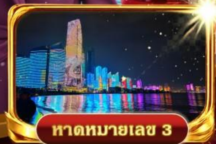
หาดหมายเลข 3