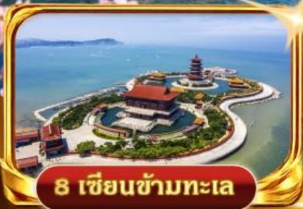
8 เซียนข้ามทะเล