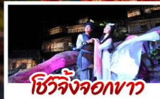
ชีวิตจริงจอกขาว