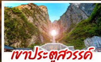
เขาประตูลี้สวรรค์