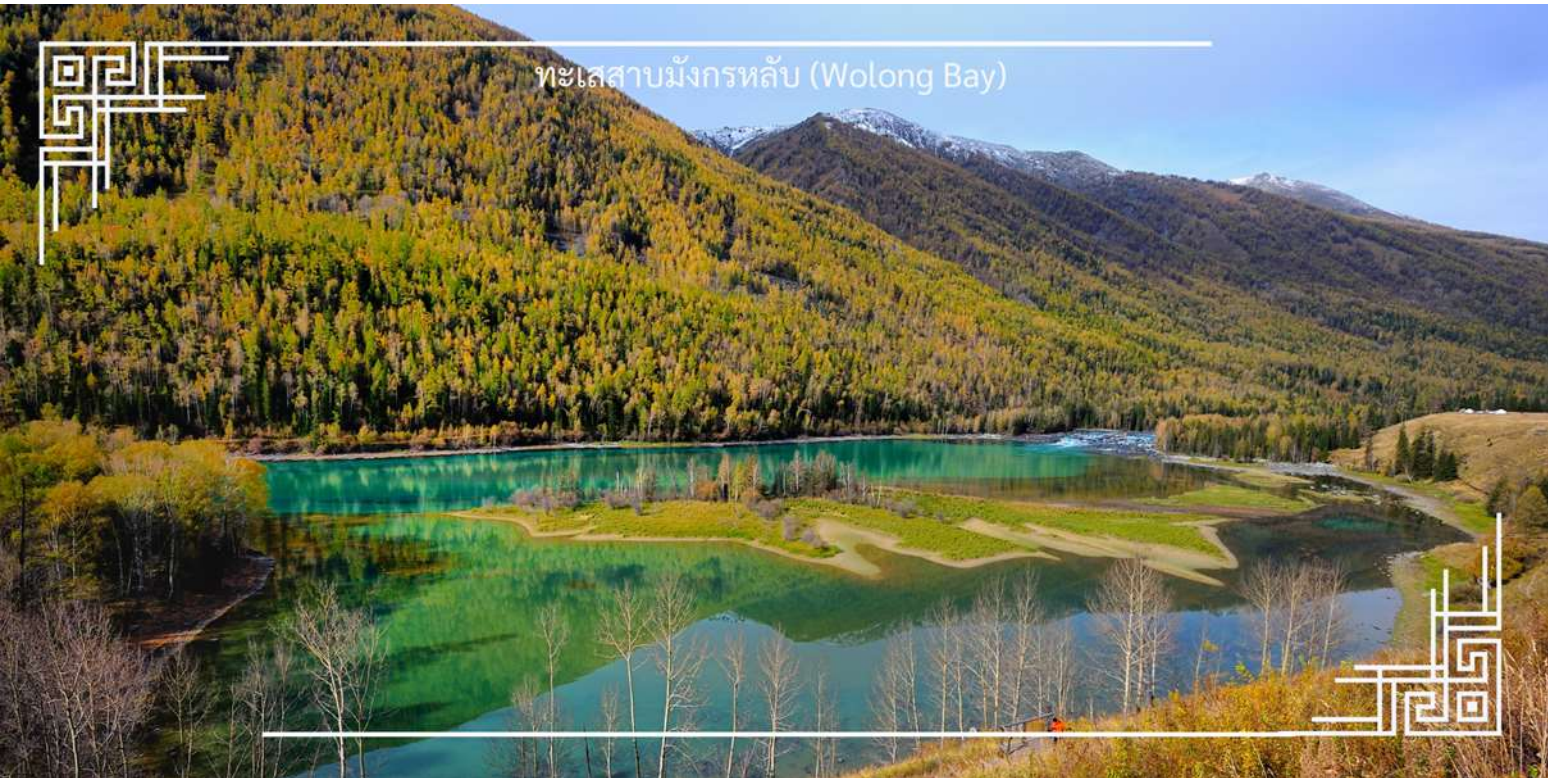
ทะเลสาบมังกรหลับ (Wolong Bay)

จากนั้นนำท่านชม ทะเลสาบเทวดา (Fairy Bay) จุดชมวิวยุคใหม่ที่ตั้งอยู่ทางตอนใต้ของทะเลสาบคานาสีอ ภายในเขตโดดเด่นด้วยผืนน้ำใสสะอาดอันเงาภูเขาและผืนป่า สร้างบรรยากาศราวดินแดนในเทพนิยาย สถานที่แห่งนี้มีชื่อเรียกตามตำนานท้องถิ่นว่า “อ่าวของเหล่าเซียน” โดยเล่าขานกันว่าเป็นสถานที่ที่เหล่าเทพเซียนลงมาเล่นน้ำ จึงยิ่งเพิ่มเสน่ห์และความลึกซึ้งให้กับทัศนียภาพอันงดงาม