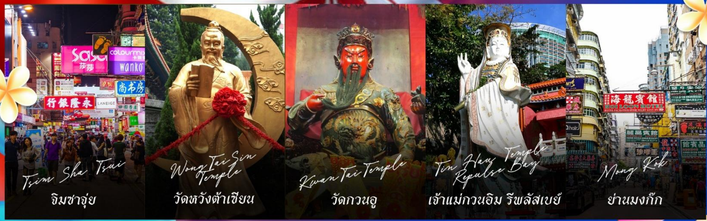
Tsim Sha Tsui จิมซาจุ่ย

รายการทัวร์ข้างต้นอาจมีการปรับเปลี่ยนเพื่อความเหมาะสม