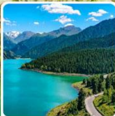
อุทยานเทียนชาน เทียนฉือ