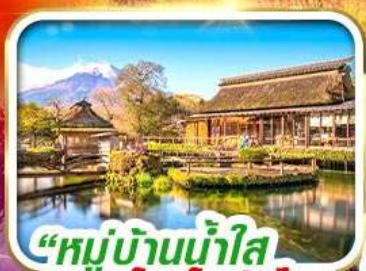
“หมู่บ้านน้ำใส โอชิโนะฮัทสึโค”