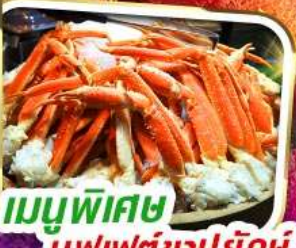
เมนูพิเศษ บุฟเฟ่ต์ขาปูยักษ์

ราคาเพียง 35,999 *รวมภาษีมูลค่าเพิ่มแล้ว*