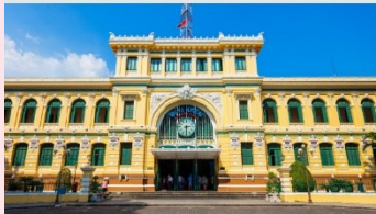
ไพรบิชย์กลางโฮจิมินห์