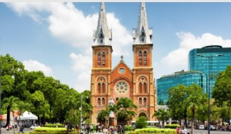
โบสถ์นอร์ทเทรอดาม