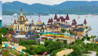
สวนสนุกวินเดอร์ส

*ทางบริษัทฯ ขอสงวนสิทธิ์ในการสลับโปรแกรมทัวร์ตามความเหมาะสมขึ้นอยู่กับสถานการณ์หน้างาน โดยคำนึงถึงผลประโยชน์ของลูกค้าเป็นสำคัญ