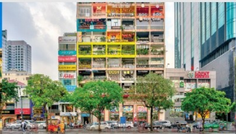
คาเฟ่ อพาร์ทเม้น