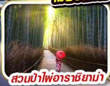
สวนป่าไฟอาราชิยาม่า