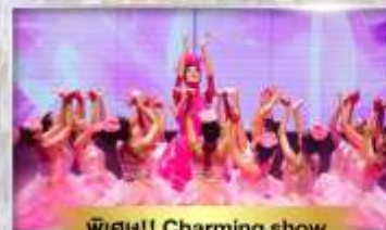
พิเศษ!! Charming show