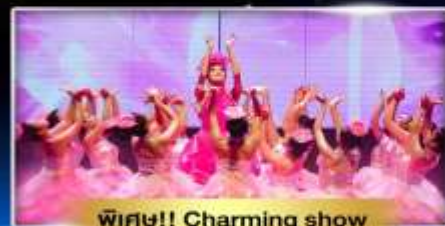
พิเศษ!! Charming show