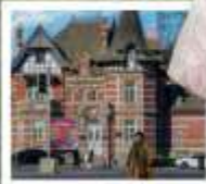
ถนนรัสเซีย