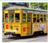
นั่งรถรางต้าเหลียน