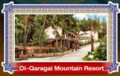
Oi-Qaragai Mountain Resort