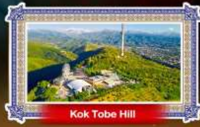
Kok Tobe Hill