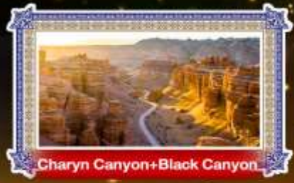
Charyn Canyon+Black Canyon