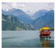
ห้องเรือทะเลสาบเทียนฉือ