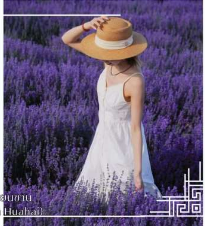
ทุ่งดอกไม้เทียนซาน (Yili Tianshan Huahai)

จากนั้นนำท่านสู่เมืองนาราลี (ใช้เวลาเดินทางประมาณ 3 ชั่วโมง)