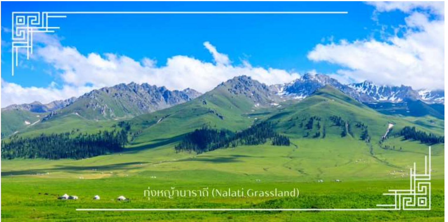
ทุ่งหญ้าบาราคี (Nalati Grassland)