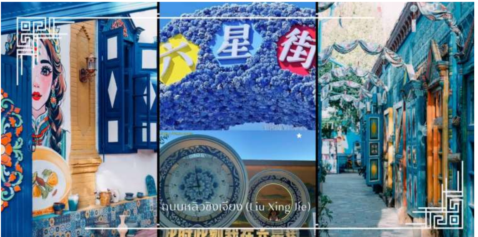
ถนนหลิวซิงเจียง (Liu Xing Jie)

อิสระช้อปปิ้ง ถนนหลิวซิงเจียง (Liu Xing Jie) เมือง อี้หนิง (Yining) ถนนคนเดินที่มีชีวิตชีวาและเต็มไปด้วยสินค้าหลากหลาย เหมาะสำหรับการเดินเล่น ช้อปปิ้ง และสัมผัสบรรยากาศท้องถิ่นอย่างใกล้ชิด สองข้างทางเรียงรายด้วยร้านค้าของฝาก งานหัตถกรรมพื้นเมือง เสื้อผ้า เครื่องประดับ อาหารท้องถิ่น และร้านกาแฟบรรยากาศอบอุ่น โดดเด่นด้วยสถาปัตยกรรมสีสันสดใสที่ผสมผสานกลิ่นอายยุโรปและเอเชียกลางได้อย่างลงตัว