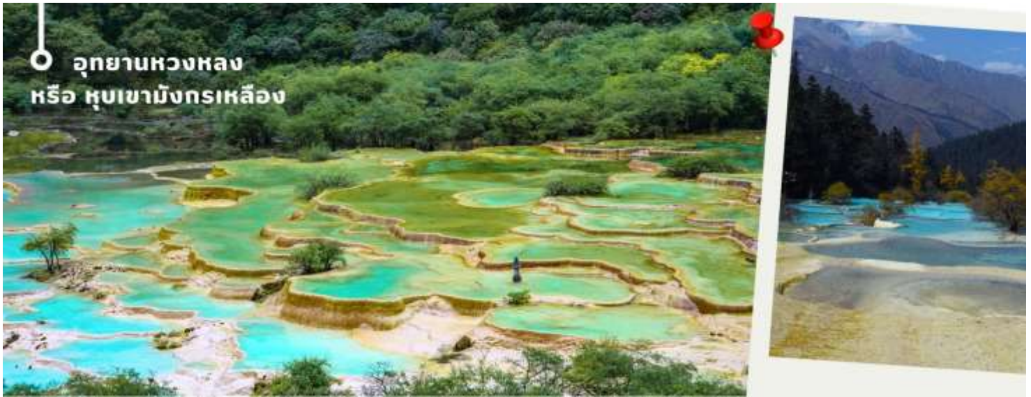
อุทยานหวงหลง หรือ หุบเขามังกรเหลือง