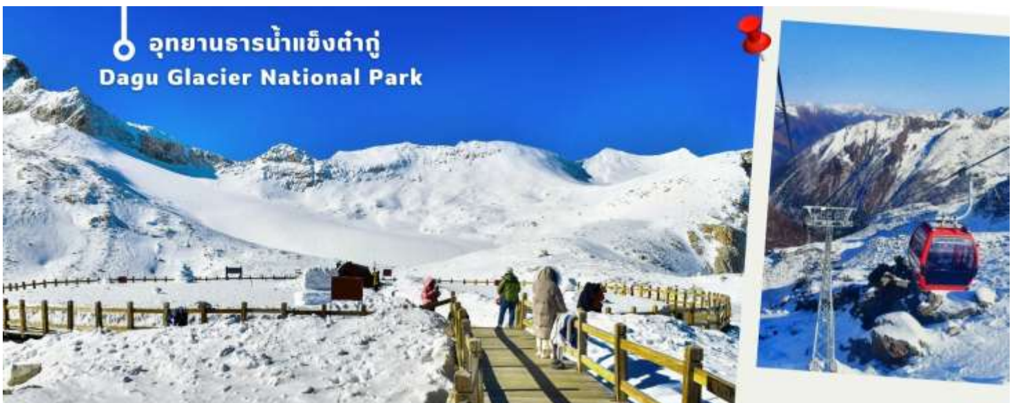
อุทยานธารน้ำแข็งต้ากู่ Dagu Glacier National Park

จากนั้นนำท่านเดินทางสู่ เมืองเฮยซู่ (ใช้เวลาเดินทางประมาณ 2 ชั่วโมง)เพื่อเดินทางไปยัง อุทยานธารน้ำแข็งต้ากู่ (รวมกระเช้าขึ้นลง) ต้ากู่ปังชวน หรือ Dagu Glacier National Park เป็นธารน้ำแข็งกลาเซียร์ที่สวยงามที่สุดแห่งหนึ่งของโลก และเป็นสถานที่ท่องเที่ยวระดับ 4A ของจีน ตั้งอยู่ที่เมืองเฮยซู่ ในมณฑลเสฉวน ห่างจากเมืองเฉิงตู ประมาณ 300 กิโลเมตร ถือเป็นธารน้ำแข็งที่อายุน้อยที่สุด ที่ตั้งอยู่ในระดับความสูงที่ต่ำที่สุด และอยู่ใกล้กับเมือง