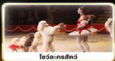
โชว์ละครสัตว์