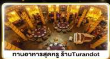
ทานอาหารสุดหรู ภัตตาคาร Turandot