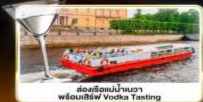
ส่งเรือแม่น้ำเนวา พร้อมลิ้ม Vodka Tasting