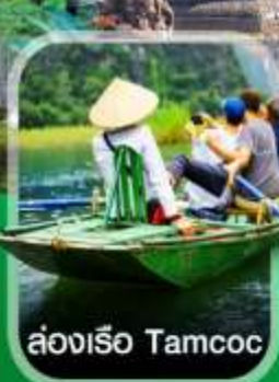
ล่องเรือ Tamcoc

✈️ คอนเฟิร์มออกเดินทาง ✈️ ทุกพีเรียด 2 ท่านขึ้นไป