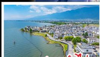
ทะเลสาบเอ๋อไห่