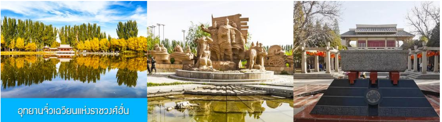
อุทยานจิวเจวียนแห่งราชวงศ์ฮั่น

จากนั้นนำท่านเดินทางสู่เมืองจิวเจวียน (ระยะทาง 50 กม. ใช้เวลาเดินทาง 1 ชั่วโมง)