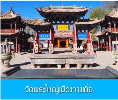
วัดพระใหญ่เมืองจางเยี่ย