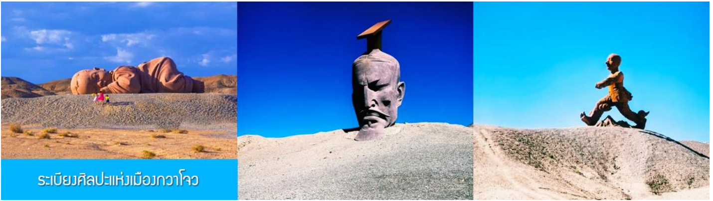
ระเบียบศิลปะแห่งเมืองกวโจว