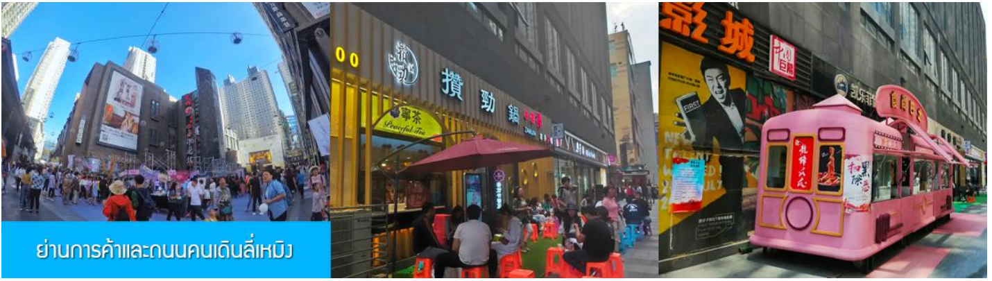
ย่านการค้าและถนนคนเดินลี่หมิง

หลังอาหารนำท่านสู่ ย่านการค้าและถนนคนเดินลี่หมิง 力盟商业步行街 ย่านการค้าทันสมัยที่มี ห้างสรรพสินค้าขนาดใหญ่หลายแห่ง ถนนคนเดินที่คึกคักไปด้วยร้านค้าแบรนด์ท้องถิ่น ร้านอาหารพื้นเมือง ร้านสะดวกทานฟาสต์ฟู้ด ให้ความอิสระท่านเดินชท ช้อปปิ้ง ชิมอาหารพื้นเมืองเต็มที่