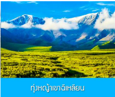
ทุ่งหญ้าฉีเหลียน

จากนั้นนำท่านเดินทางโดยรถบัสสู่ทุ่งหญ้าฉีเหลียน (ระยะทาง 140 กม. ใช้เวลาเดินทางประมาณ 2 ชั่วโมง)