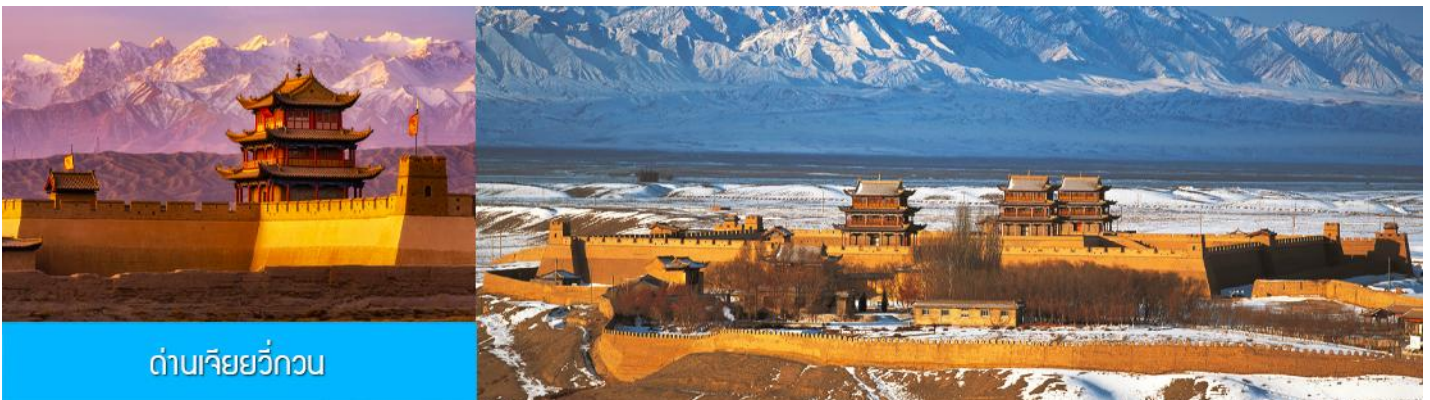
ด่านเจียยวี่กวน

รับประทานอาหารเช้า ณ ห้องอาหารของโรงแรม (12)