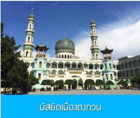
มัสยิดเมืองตงกวน

เช้า บริการอาหารเช้า ณ ร้านอาหารในโรงแรม (17)