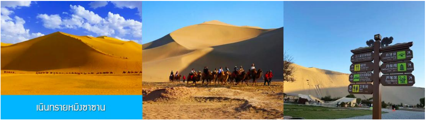
เนินทรายหมิงซาซาน