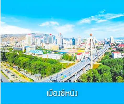
เมืองซีเหมิน