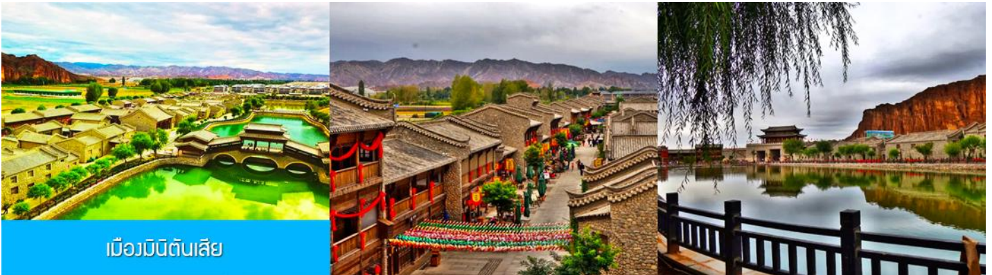
เมืองมินิดินสี