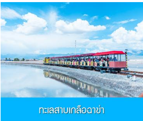
ทะเลสาบเกลือฉาซ่า