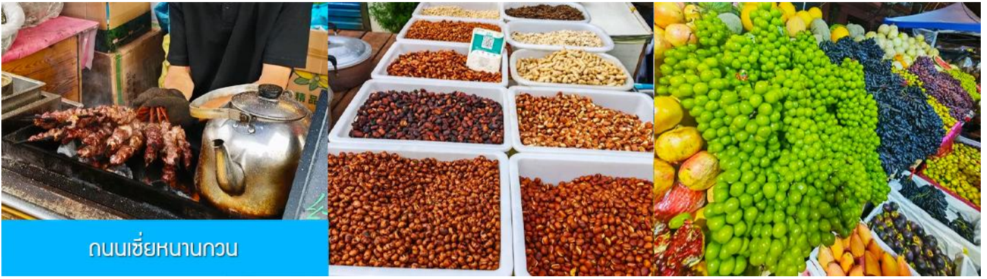
ถนนเซี่ยหนานกวน