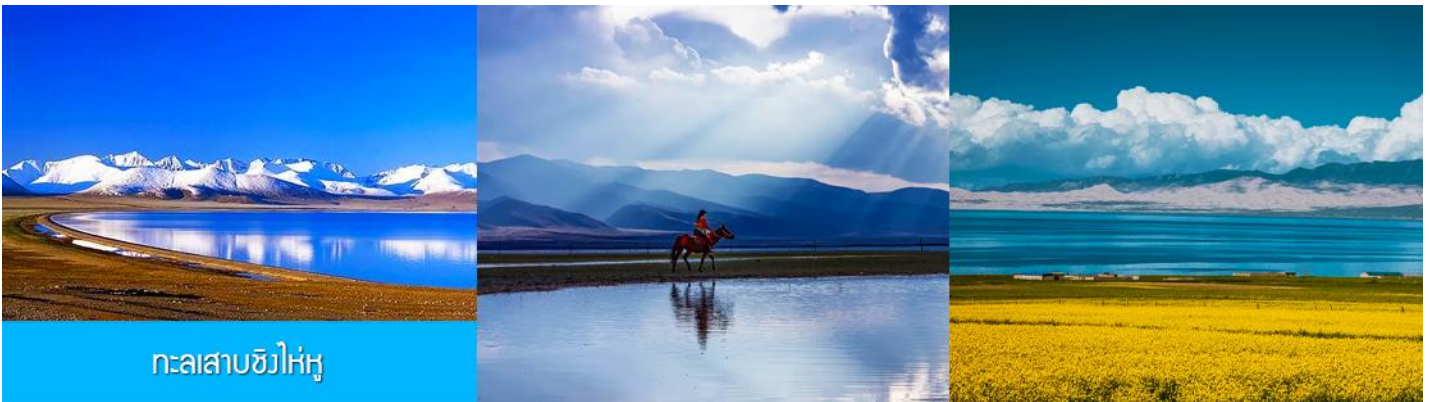
ทะเลสาบชิงไห่หู

นำท่านเดินทางสู่ ทะเลสาบชิงไห่หู (ระยะทาง 150 กม. ใช้เวลาเดินทางราว 2 ชั่วโมงเศษ)