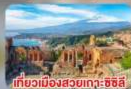
เที่ยวเมืองสวยเกาะซิซิลี Taormina