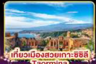
เที่ยวเมืองสวยเกาะซซิลี Taormina