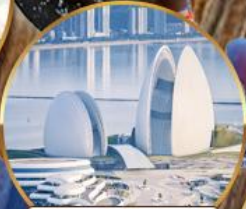
โรงละครหอไข่มุก