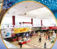
ตลาดกังเป๋ย