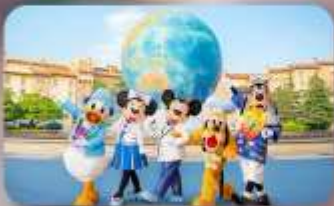
อิสระตามอียาสัย 2 วัน

HOTEL ASIA NARITA ห้องเตียงสามมาตรฐานญี่ปุ่น