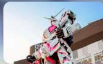
ช้อปปิงโอไดบะ