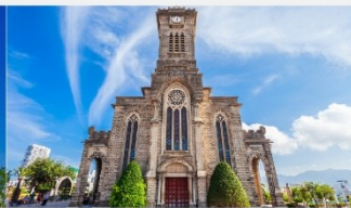
โบสถ์หินญางอง