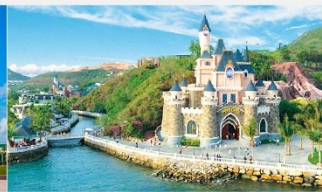
สวนสนุกวินเดอร์ส

*ทางบริษัทฯ ขอสงวนสิทธิ์ในการสลับโปรแกรมทัวร์ตามความเหมาะสมขึ้นอยู่กับสถานการณ์หน้างาน โดยคำนึงถึงผลประโยชน์ของลูกค้าเป็นสำคัญ