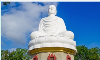
วัดลองเซิน