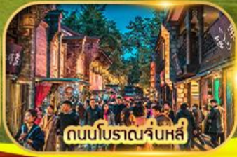
ถนนโบราณจื๋นหนี่