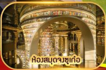
ห้องสมุดจางซูเก๋อ