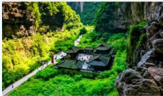
อุทยานแห่งชาติหลุมฟ้า