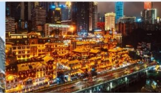
หงหยาดัง(ชมไฟยามค่ำคืน)

*ทางบริษัทฯ ขอสงวนสิทธิ์ในการสลับโปรแกรมทัวร์ตามความเหมาะสมขึ้นอยู่กับสถานการณ์หน้างาน โดยคำนึงถึงผลประโยชน์ของลูกค้าเป็นสำคัญ