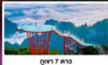
ภูเขา 7 ดาว