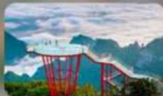
กูเยา 7 ดาว