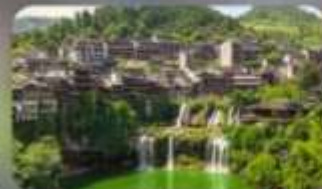
หมู่บ้านโบราณฟุทรงเจิน