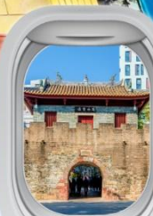
เมืองโบราณหนาวโกว