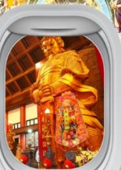
วัดฯชางหมิว