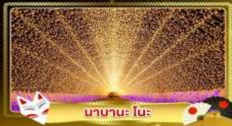
นานาเนะ โนะ