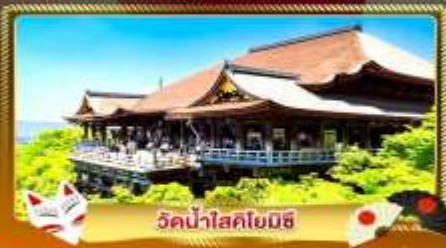
วัดน้ำใสโยมิชิ

ชมงานประดับไฟสุดอลังการ นานาเนะ โนะ ซาโตะ