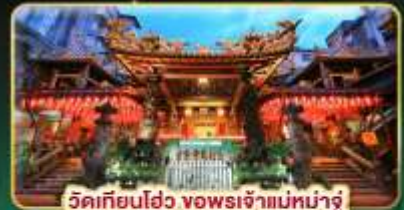
วัดเทียนโฮ่ว ขอพรเจ้าแม่หน่าจู้