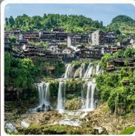
ฟูรงเจิน