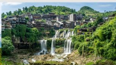
หมู่บ้านโบราณฝูหลงเจิน