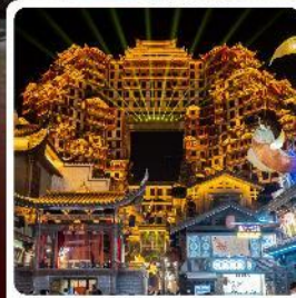
ตึกมหัศจรรย์ 72