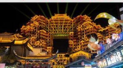
ตึกมหัศจรรย์ 72