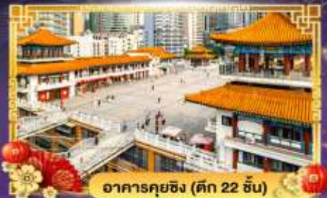
อาคารคุยฉิ่ง (ตึก 22 ชั้น)