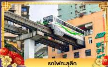
รถไฟฟ้า-ลูตัก