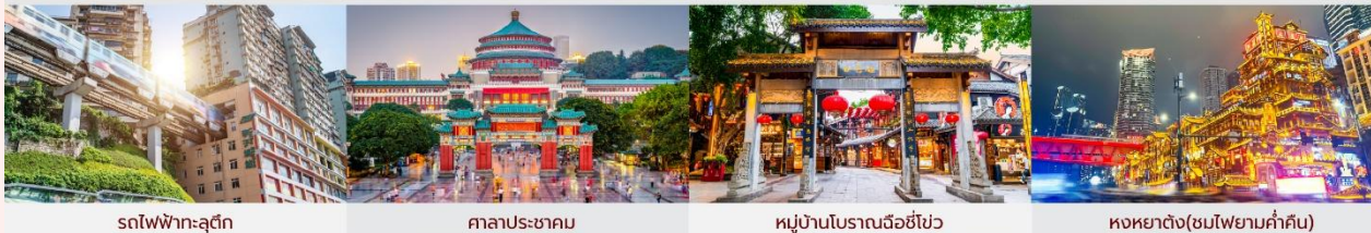
รถไฟฟ้าทะเลสาบ