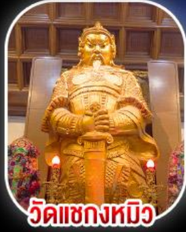
วัดเขกหมิว