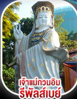
เจ้าแม่กวนอิม รีพัสลีย์