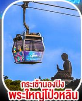
กระเช้าเองปีง พระใหญ่โป่วหลิน