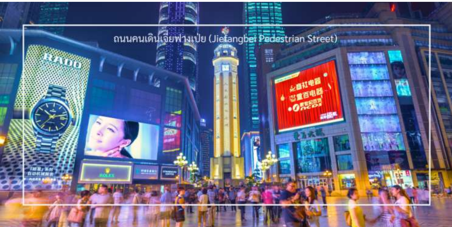
ถนนคนเดินเจี๋ยฟางเป่ย์ (Jiefangbei Pedestrian Street)

เครื่องประดับ และของที่ระลึก ท่านสามารถ แวะช้อปปิ้งร้านดัง “POPMART” ร้านดังจากจีน ที่รวมฟิกเกอร์ดีไซน์เก๋และตุ๊กตาน่ารักหลากหลายซีรีส์ยอดนิยม เช่น Molly, Dimoo, Labubu และอีกมากมาย ที่สายสะสมของเล่นไม่ควรพลาด เย็น อีศระอาหารเย็นให้ท่านรับประทานอาหารตามอัธยาศัย