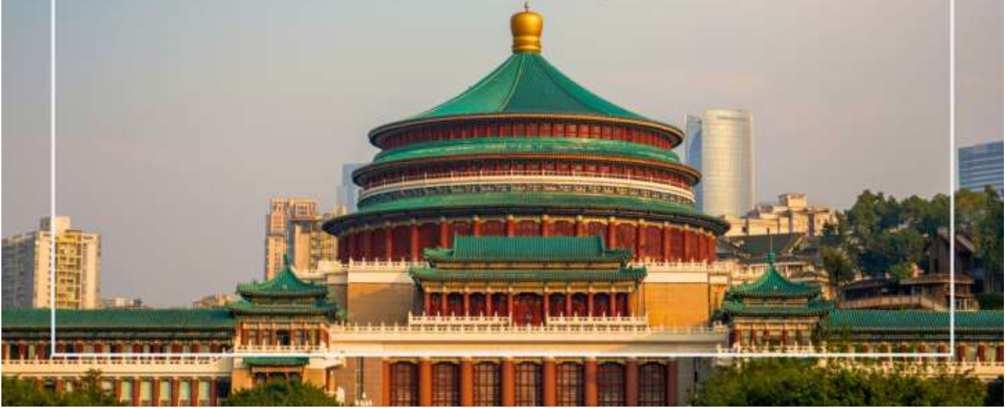
มหาศาลาประชาชนแห่งเมืองฉงชิ่ง (Chongqing People's Grand Hall)

เที่ยง บริการอาหารเที่ยง ณ ภัตตาคาร (มื้อที่ 7) เมนูพิเศษ : สุกี้หม่าล่า