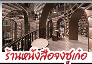
ร้านหนังสือจชชู่เก้อ

อุทยานภูเขาสี่ดรุณี อุทยานป่าผิงโกว หมีแพนด้าแอนเซลฟี ร้านหนังสือจชชู่เก้อ ถนนโบราณความจำ ซุปปิ้งย่านคิง ถนนไท่กู่หลี่ + ถนนซุนซู่ เบบูพิเศษ สุกี้หมาล่าเสววน