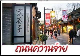
ถนนความจำ