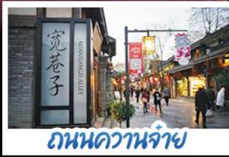
ถนนดวานจ้าย