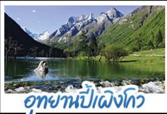
อุทยานปี่ฝิ่งโกว

ภูเขาสัตรีณี อุทยานจิวจ้ายโกว นั่งรถไฟความเร็วสูง น้ำพุไม้ไฟตักSKP อุทยานปี่ฝิ่งโกว วัดต้าฉือ ถนนโบราณชอยกว้างชอยแคบ ซ้อปบั้งถนนไถ่กู่หลี่ + ถนนซุนซีลู่