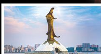
เจ้าแม่กวนอิมริมทะเล