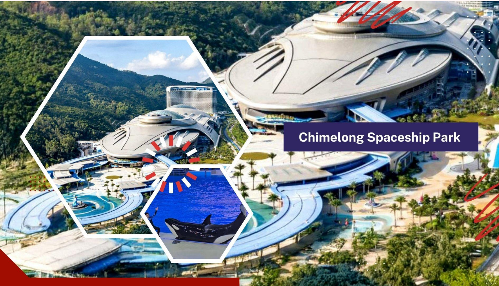
Chimelong Spaceship Park

** อีสาระอาหารเที่ยง และอาหารค่ำ เพื่อไม่ให้เป็นการเสียเวลาในการท่องเที่ยว **