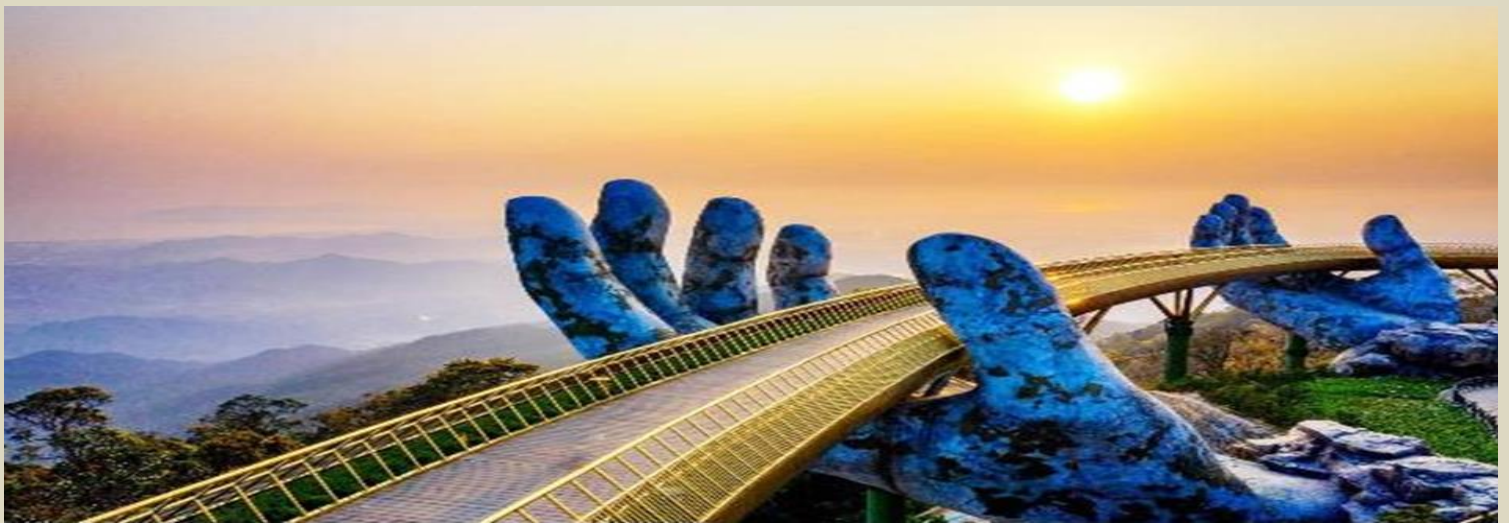
2UDAD-EK006 เวียดนามกลาง ดานัง ฮอยอัน บานาฮิลล์ พัก 3 เมือง 4 วัน 3 คืน โดยสายการบิน Emirates Airline (EK)