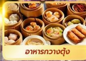
อาหารกวางตุ้ง