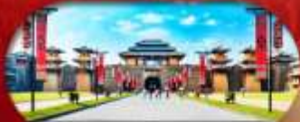
Hengdian World Studios โรงละครจำลองที่ใหญ่ที่สุดในโลก

เชียงใหม่ หางโจว เหิงเตี้ยน ล่องเรือทะเลสาบซีหู