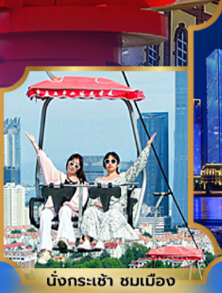
นั่งกระเช้า ชมเมือง