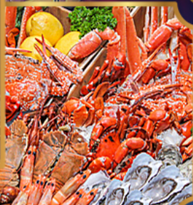
อาหารซีฟู้ดจัดเต็ม

บุฟเฟต์เบียร์ไม่อื่น + ซีฟู้ด + ปิ้งย่างเกาหลี