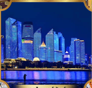
หาดโซเบอร์ฟังก์