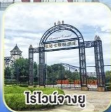
ไร่วินิจฉัยยู