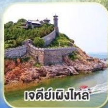
เจดีย์เฝิงไหล