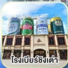
โรงเบียร์ซิงเต่า