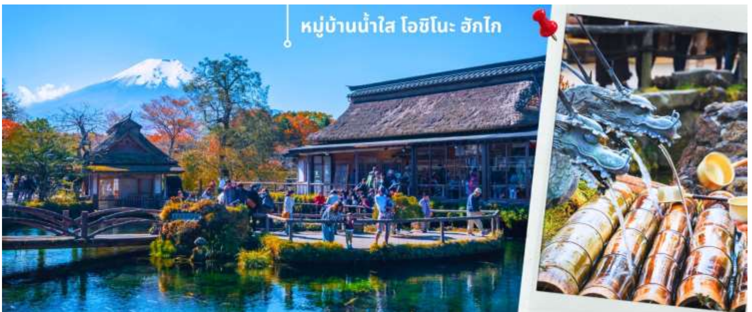
หมู่บ้านน้ำใส โอชิโนะ ฮักไก

หลังรับประทานอาหารเช้า นำท่านเดินทางสู่ หมู่บ้านน้ำใส โอชิโนะ ฮักไก (Oshino hakkai) ถือเป็นหมู่บ้านแห่งการท่องเที่ยวที่ยังคงความอุดมสมบูรณ์ของธรรมชาติเอาไว้ได้อย่างดีในหมู่บ้านมีบ่อน้ำใสที่เป็นน้ำที่ละลายมาจากหิมะบนภูเขาไฟฟูจิ ที่นี้มีความสวยงามในระดับที่ว่าได้รับการขึ้นทะเบียนให้เป็นมรดกทางธรรมชาติ ในปี ค.ศ. 1934