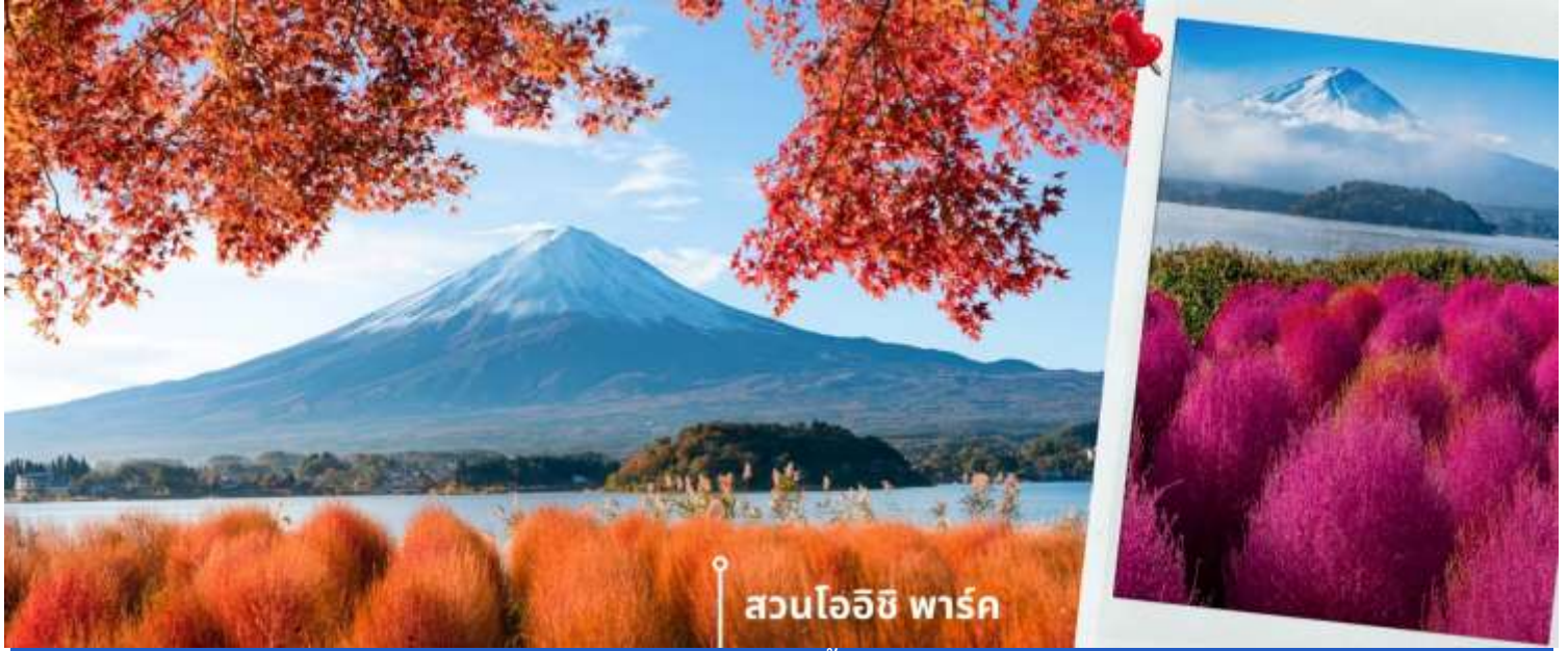
สวนโออิชิ พาร์ค

และไฮไลท์ที่พลาดไม่ได้ที่สุดคือ ทุ่งต้นโคเคีย (Kochia) พุ่มไม้กลมสีแดงสด ที่เรียงรายทั่วสวนที่เป็นเอกลักษณ์ของ สวนโออิชิ พาร์ค บวกกับวิวเบื้องหลังที่เป็นภูเขาไฟฟูจิตั้งตระหง่านอย่างสง่างาม เหมาะแก่การถ่ายภาพและให้ท่าน ได้ชื่นชมความสวยงามตามอัธยาศัย