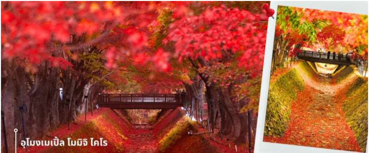
อุโมงค์ไบเมเปิ้ล โมมิจิ ไคโร

จากนั้นนำท่านเดินทางสู่ อุโมงค์ไบเมเปิ้ล โมมิจิ ไคโร (Momiji Kairo) จุดชมใบไม้เปลี่ยนที่สวยงามบริเวณ ทะเลสาบคาวากุจิโกะ ต้นเมเปิ้ลที่ขึ้นอยู่ทั้ง 2 ฝั่งของคลองน้ำจะเปลี่ยนสีทั้งส้มและแดง ตั้งอยู่บริเวณทะเลสาบคาวากุจิโกะ หนึ่งในห้าทะเลสาบที่อยู่รอบภูเขาไฟฟูจิ เป็นทางเดินเลียบบแม่น้ำสายเก่าที่มีต้นเมเปิ้ลเรียงรายสองข้างทาง เมื่อถึงฤดูใบไม้ร่วง ไบเมเปิ้ลจะเปลี่ยนสีเป็นสีส้มสดใสราวกับพรมปูเต็มพื้นดินและผิวน้ำ สร้างเป็นอุโมงค์สีสันที่งดงามตระการตา ผู้มาเยือนจะได้สัมผัสกับบรรยากาศที่เงียบสงบและโรแมนติก พร้อมกับดื่มด่ำกับความงามของธรรมชาติอย่างเต็มที่