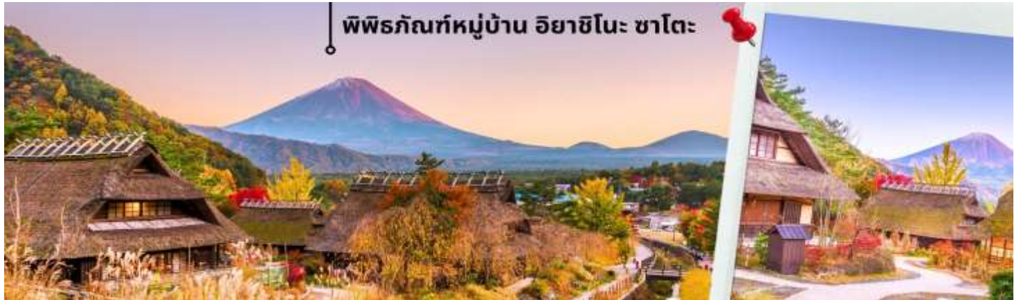
พิพิธภัณฑ์หมู่บ้าน อียาชิโนะ ซาโตะ

สิ้นสุดลงและไม่สามารถเข้าชมได้** จะพาท่านเดินทาสวมใบไม้เปลี่ยนสีที่ พิพิธภัณฑ์หมู่บ้านอียาชิโนะ ซาโตะ (Iyashi no Sato) ซึ่งตั้งอยู่บริเวณฝั่งตะวันตกของทะเลสาบไซโกะ เป็นหมู่บ้านโบราณที่ได้รับการบูรณะและฟื้นฟูขึ้นมาใหม่หลังจากถูกทำลายโดยพายุไต้ฝุ่นในปี 1966 ปัจจุบันกลายเป็นพิพิธภัณฑ์กลางแจ้งที่มีเอกลักษณ์ที่ผสมผสานประวัติศาสตร์ วัฒนธรรม และทัศนียภาพธรรมชาติอันงดงามเข้าด้วยกัน ให้ท่านได้สัมผัสวิถีชีวิตดั้งเดิมของชาวญี่ปุ่นในยุคโบราณ ท่ามกลางวิวภูเขาไฟฟูจิที่งดงาม และไฮไลท์ของการเที่ยวพิพิธภัณฑ์หมู่บ้านอียาชิโนะ ซาโตะ ในช่วงกลางเดือนพฤศจิกายน หมู่บ้านอียาชิโนะ ซาโตะ จะถูกแต่งแต้มด้วยสีสันของใบไม้ที่เปลี่ยนเป็นสีแดง ส้ม และเหลือง สร้างบรรยากาศที่อบอุ่นและโรแมนติก คือตลอด 2 ชั่วโมงจะมีใบไม้เปลี่ยนสีเรียงราย ช่วยเพิ่มความสวยงามโดยรอบพร้อมกับบรรยากาศบ้านที่หลังคามุงฟางรับกับวิวภูเขาไฟฟูจิ