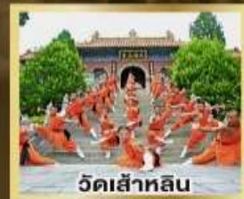
วัดเส้าหลิน