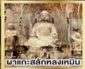
ผาแกะสลักหลงเหมิน