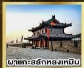
ผาแกะสลักหลงเหมิน