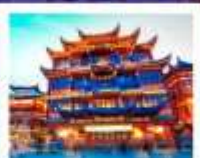
ตลาดร้อยปีฉงหวงเหมียว