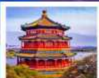
พระราชวังฤดูร้อนที่ตงหยวน