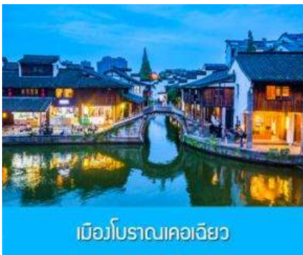
เมืองโบราณเคอเจียว