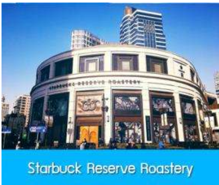
Starbuck Reserve Roastery