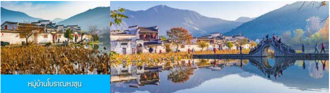
หมู่บ้านโบราณหงชุน

หลังอาหารเช้าท่านเดินทางสู่เมืองฉุนซี (หวงชาน) (ระยะทาง 298 กม. ใช้เวลาเดินทางโดยรถบัสราว 4 ชั่วโมง) นำท่านเที่ยวชม หมู่บ้านโบราณหงชุน 宏村 หมู่บ้านโบราณขึ้นชื่ออายุกว่า 800 ปีที่ได้รับการขึ้นทะเบียนเป็นมรดกโลกทางวัฒนธรรมจาก UNESCO ชมบ้านเรือนโบราณที่ถูกสร้างขึ้นในยุคราชวงศ์หมิง และราชวงศ์ชิงที่ยังคงสภาพที่สมบูรณ์กว่า 140 หลัง นำท่านเที่ยวชมตามจุดเช็คอินขึ้นชื่อภายในหมู่บ้าน อาทิ บึงน้ำพระจันทร์ ทะเลสาบหนานหู โรงเรียนหนานหู หอบรรพบุรุษ คลองน้ำหงชุน ต้นไม้โบราณ ฯลฯ