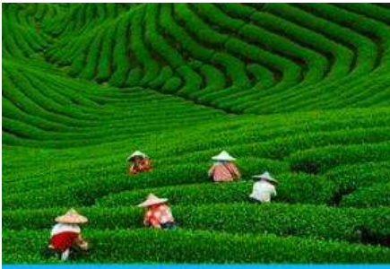
หมู่บ้านใบชา เหมยเจียว