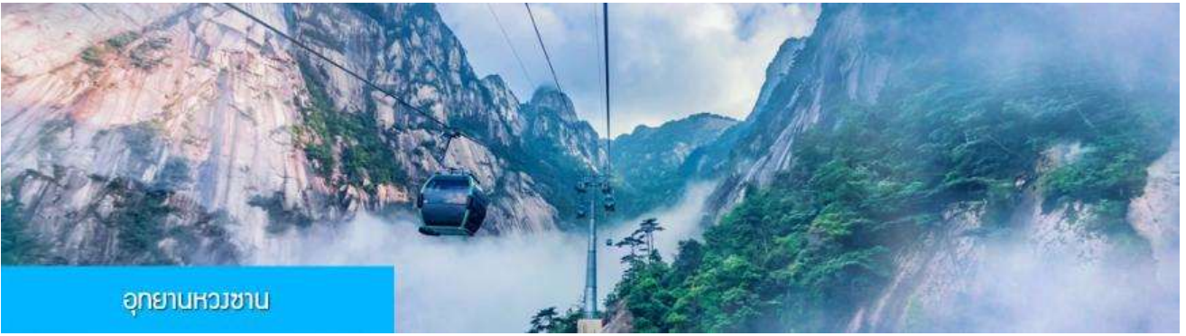
อุทยานหลวงซาน