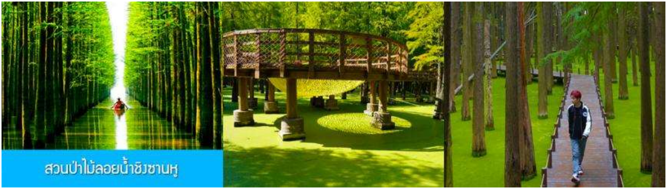
สวนป่าไม้ลอยน้ำชิงชานหู