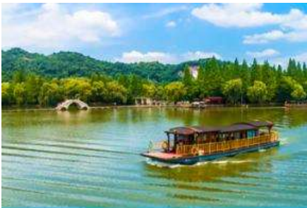
ล่องเรือทะเลสาบเจียนหู