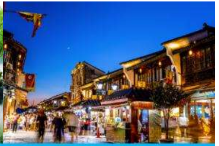
ย่านเหอฝางเจีย

วันที่หก นครหังโจว – หมู่บ้านใบชา-เที่ยวชมริมทะเลสาบซีหู- ย่านเหอฝางเจีย – เดินทางสู่สนามบิน