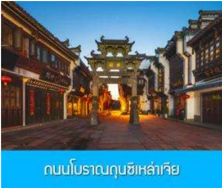
ถนนโบราณถนนซีหล่าเจีย