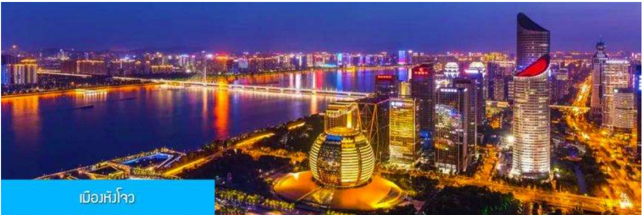
เมืองหังโจว