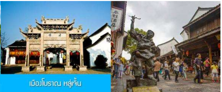
เมืองโบราณ หลู่เจิ้น

นำท่านล่องเรือในทะเลสาบเจียนหูผ่านชมทัศนียภาพที่งดงามราวภาพเขียนของสองฝั่ง ที่มีทั้งสะพานโค้ง โบราณ ศาลาเก๋งจีน และบ้านเรือนโบราณ.....นำท่านเที่ยวชม เมืองโบราณ หลู่เจิ้น 鲁镇 เมืองโบราณที่โด่งดังจากนักประพันธ์ที่มีนามว่า หลู่จวิน 鲁迅 ที่นี้เป็นเมืองโบราณริมน้ำสไตล์เจียงหนานของจีน