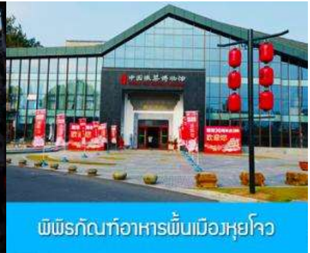
พิพิธภัณฑ์อาหารพื้นเมืองหูโจว

นำท่านเที่ยวชม ถนนโบราณถนนซีหล่าเจีย 屯溪老街 ถนนที่เป็นย่านการค้าโบราณในยุคราชวงศ์ซ่งอายุกว่าพันปี ถนนมีความยาวราว 980 เมตร สองฝั่งถนนมีอาคารบ้านเรือน โบราณสไตล์หุโจว ยุคปลายราชวงศ์หมิง และราวส์ซิงที่ถูกอนุรักษ์ไว้เป็นอย่างดี ปัจจุบันยังมีห้างร้าน โบราณ อาทิ ร้านขาย โบราณวัตถุ ร้านขายหยก ร้านขายภาพเขียนและอักษรพู่กัน โบราณ ร้านอาหารพื้นเมือง ร้านขายของที่ระลึก ฯลฯ นอกจากร้านค้าและอาคารบ้านเรือน โบราณที่นี่ยังเป็นแหล่งรวมของนักท่องเที่ยวที่มาชิมอาหารพื้นเมือง เดินช้อปปิ้ง และถ่ายภาพ เซ็คอิน