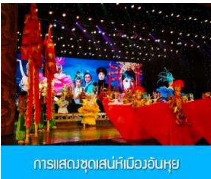
การแสดงชุดเสน่ห์เมืองอันหุย

ทางทัวร์แจกคู่มืออาหารมูลค่า 20 หยวน/ท่าน (12) สามารถใช้คู่มือแลกซื้ออาหารพื้นเมืองชนิดต่าง ๆ ได้พักที่ TONGJULOU HOTEL โรงแรมระดับ 4 ดาวท้องถิ่น เมืองฉุนซี